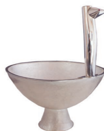
Coupe de Thierry Pelletier « Buste »